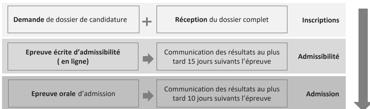
Schéma général de recrutement et d'admission